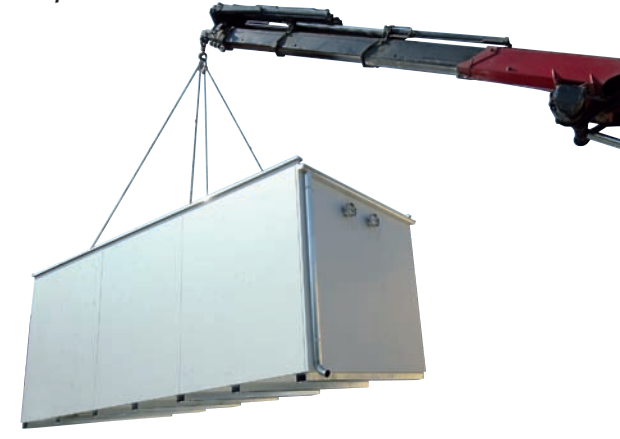
Central térmica 10 - 1.500 kW