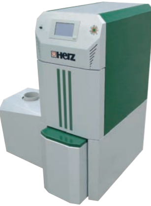
firematic 20 - 60 kW