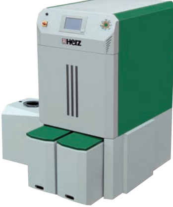
firematic 80 - 499 kW