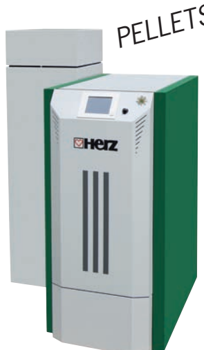
pelletstar 10 - 60 kW