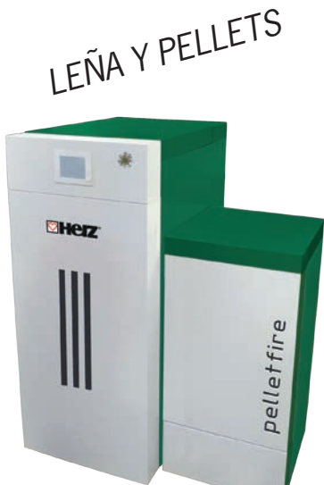
pelletfire 20 - 40 kW