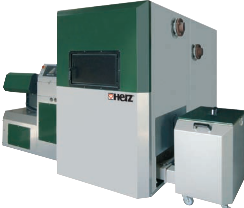
BioMatic 300 - 450 kW