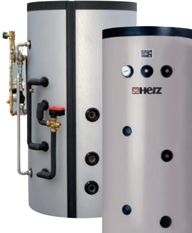
Depósitos y acumuladores 6 - 90 kW