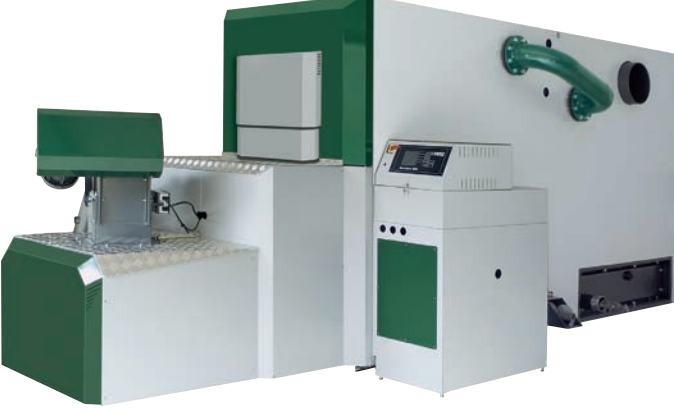
BioFire 500 - 1.500 kW