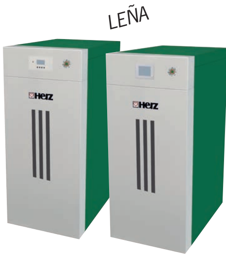
firestar 18 - 40 kW

La astilla se eleva mediante un sinfin vertical y se reparte de forma óptima en el almacén mediante un sinfin horizontal.