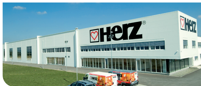
Centro de producción HERZ (Austria).