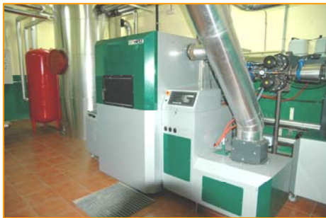
CALDERAS BIOMATIC 500KW