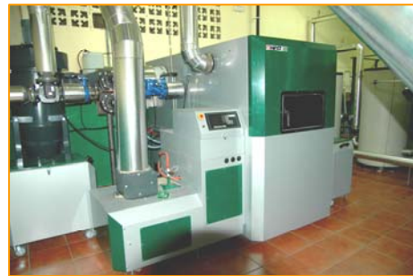
CALDERAS BIOMATIC 500KW

DESCRIPCIÓN: Calefacción, Agua Caliente Sanitaria para 68 viviendas, con un tamaño cada una de ellas de 130m 2 .