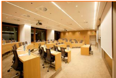
SALA DE CONFERENCIAS