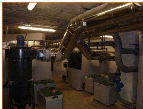
SALA DE CALDERAS